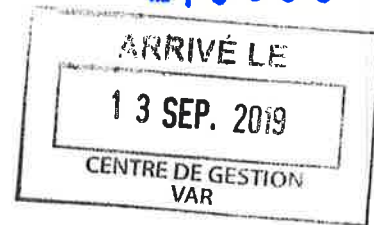
TABLEAU ANNUEL D'AVANCEMENT AU GRADE DE TECHNICIEN PRINCIPAL DE 2 ème CLASSE ARRETE N° RH/2019-163

Le Directeur Général de Terres du Sud Habitat,